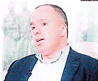
KIKO Questionado judicialmente por condenação em Rio Grande

Então, novamente o processo para. Peninha ingressa com pedido de esclarecimentos à juíza Ida Inês Del Cid no dia 26 de outubro de 2023 a respeito da morosidade do an-