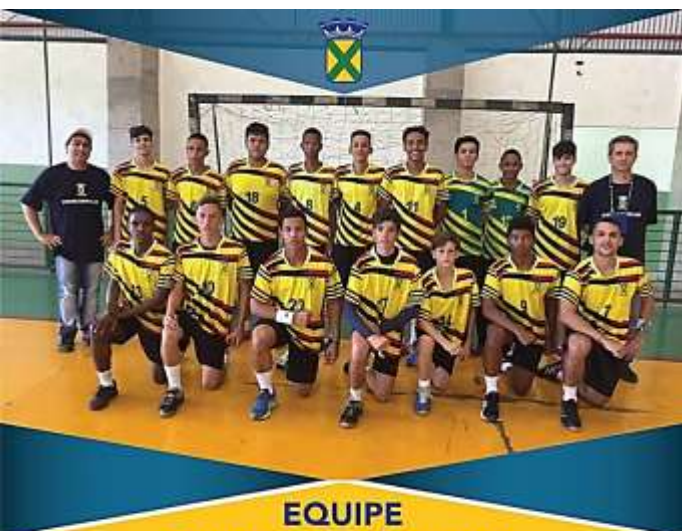
EQUIPE CADETE MASCULINO