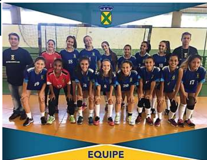
EQUIPE CADETE FEMININO